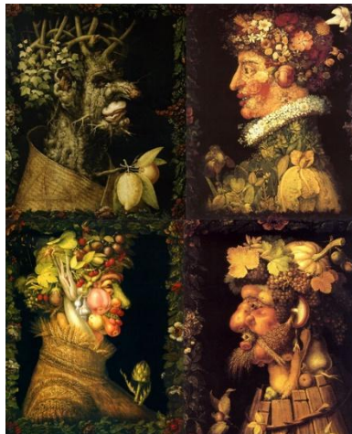
Les Saisons (1563) ARCIMBOLDO

Les Quatre Saisons de Vivaldi Pour ensemble à cordes et instruments basques