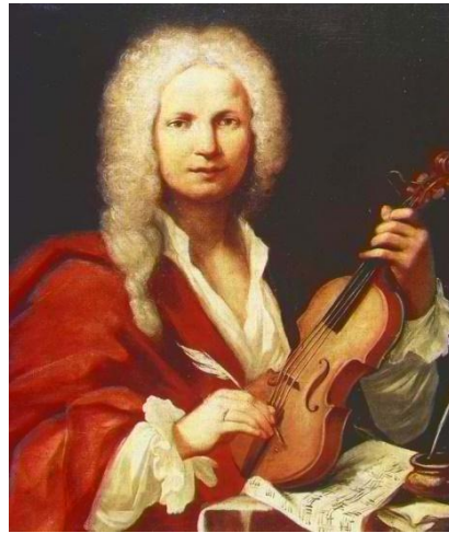
Portrait supposé d'Antonio Vivaldi, Bologne, 1723