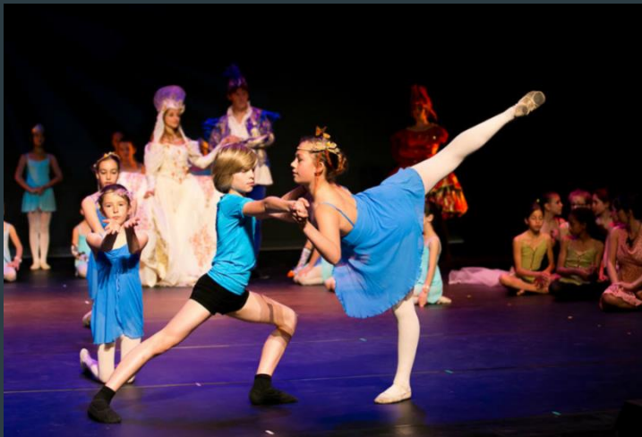
CHAM CHAD CHAT 2018-2019